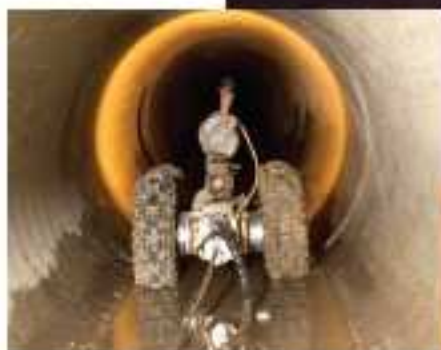
Inspection du réseau par une caméra autotractée et pivotante

+ 1,7 km de canalisations inspectées (collecteurs d'eaux usées et deux pluviales) + Environ 500 K€ HT d'étude et de travaux pour la partie "Réseau". En partie financés par les partenaires de la Ville (Agence de l'Eau...)