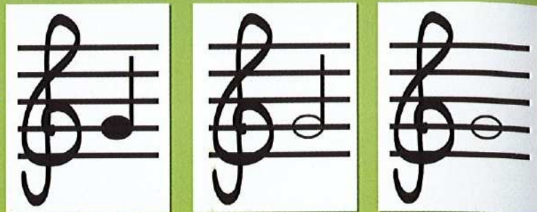
Sol "Noire" Tu dis Sol

Gardons les 3 mêmes valeurs de notes pour le Sol. On obtient